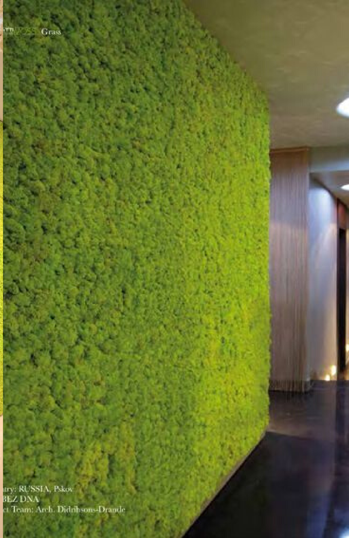
Location: RUSSIA, Pskov Client: BEZ DNA Design Team: Arch. Didriksons-Drancle